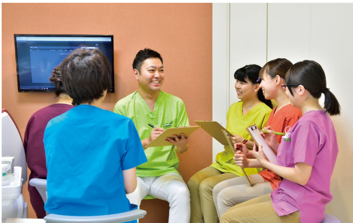
歯科医療の基本を守り、常に「その人にとって最適なものは何か」を考え、診療を進める飯岡院長。定期的に院内勉強会を行うなど、知識や技術の研さんに日々努めている

やすく安心してできる」と好評だ。 患者に提供される資料は毎月更新 されており、100種類を超える。 また分かりやすい医院オリジナル パンフレットも多数そろえている。 スタッフ丸で日々研さん 幅広い診療ニーズに対応 患者のさまざまなニーズに応え られるよう、一般歯科全般をば