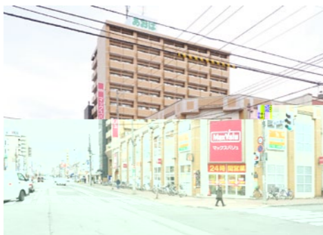
北大前通り沿い、マックスバリュ2階。地下鉄来た24条駅から徒歩近く、建物東隣りに駐車場があり、利便性も良い