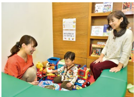
カウンセリングを大切に、子どもの場合にはキッズスペースで遊びながら、子どもが怖がることなく治療が行えるような配慮も。親子3代家族みんなで通える歯科医院と評判

幌市立白楊幼稚園の学校医などを 務めており、子どもの健全な発育 のサポートに力を入れる。家庭全 体と協力して、健やかで幸せな子 どもの将来のため、予防処置や予 防指導、痛くない怖くない治療に 努めている。 衛生管理の徹底で安心・安全を提供 徹底した衛生管理による院内感 染防止にも最大限取り組みている。 歯を削るハンドピースなど、治療 器具は滅菌したものを患者ごとに 交換。診察中に使用するグローブ も患者ごとに新しいものに交換。 滅菌処理できないものは使い捨て 製品を使用。新たに最新の滅菌器 も導入。院内も清潔に清掃され、 快適な空間に配慮した環境づくり も、安心・安全につながっている。