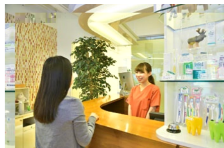
明るいスタッフがお出迎え。受付専属スタッフがキッズスペースの子どもを見守ってくれるので安心。歯科医院専用ケアグッズやカラフルな歯ブラシなども豊富に用意している

ファミリー歯科の名の通り、赤 ちゃんからお年寄りまで、あらゆる 年代の患者が安心して通える。 「目指すのは、自分が受けたい、 家族に受けさせたい歯科医療。お