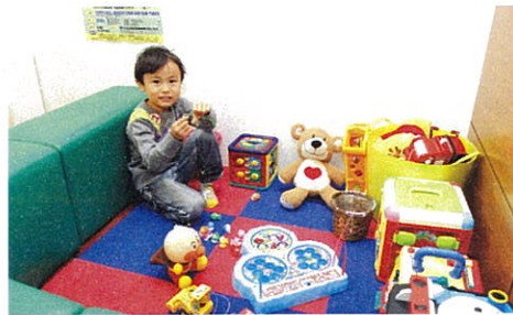
木のぬくもりあふれる待合室にはキッズスペースを備え、子どもも楽しく遊びながら過ごせるよう配慮されている

歯医者には怖いところというイメージがあるが、明るく話しやすい人柄と笑顔のやさしさから子どもも怖がることなく治療が受けられると評判。お母さんからも安心して通える歯医者さん」と親しまれている。