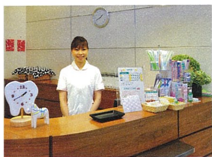
スタッフは明るく親切。いつも笑顔で迎えてくれる

「実は歯医者って苦手だったんだけど、孫や娘が通っている様子を身近で見ていると、ここなら私も安心して通えるかしら」と、娘から紹介され通い始めた患者も多い。「歯医者に通うようになってから口の中がすっきりと快適で、何でもおいしく食べられるようになり、食べる楽しみがより増えました」という声も数多く寄せられています。