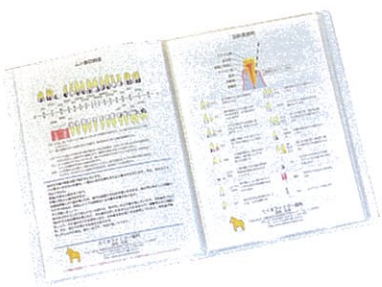
治療内容などを追加してゆく1冊の「本」は患者自身のお口の健康手帳になる

「実は歯医者って苦手だったんだけど、孫や娘が通っている様子を身近で見ていると、ここなら私も安心して通えるかしら」と、娘から紹介され通い始めた患者も多い。「歯医者に通うようになってから口の中がすっきりと快適で、何でもおいしく食べられるようになり、食べる楽しみがより増えました」という声も数多く寄せられています。