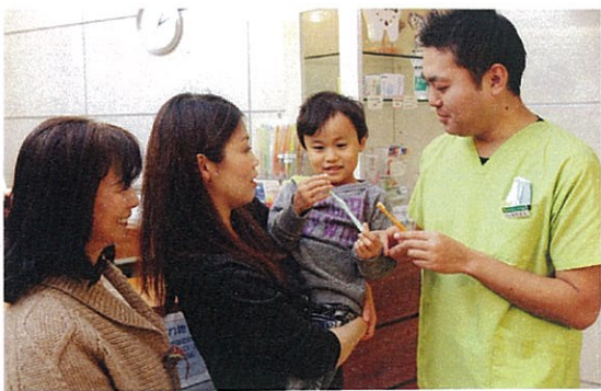
歯科医院専用の歯ブラシや歯磨き粉なども豊富にそろう。歯ブラシの形や硬さも直接さわって選べる。正しい使い方も説明してくれるので、家でのお手入れもこれでバッチリ

もは、大きくなっても通ってくれています。生え変わった大人の歯は一生使うもの。虫歯になって治療を受けた歯は、健康なままの歯に比べて、やはり寿命が短くなる傾向にあるといわれています。いつまでも健康な歯を守るためにも、お家でのケアと定期的な歯科受診を習慣づけてほしいですね」